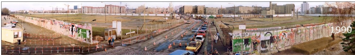
1990 © Jacques Obers